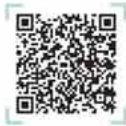
رشته‌های دانشگاهی ریاضی و فیزیک

دلیل بسیاری از انتخاب رشته‌های اشتباه، نداشتن شناخت کافی از رشته‌ها است. خیلی از شما دانش‌آموزان اگر در رشته ریاضی باشید فقط رشته‌های عمران، برق، مکانیک و غیره را تا حدودی می‌شناسید. اگر تجربی باشید که تکلیف روشن است پزشکی، دندان پزشکی و داروسازی را به عنوان رشته‌های خوب می‌شناسید و بقیه رشته‌ها را اصلاً در نظر نمی‌گیرید. تازه از سختی‌های این ۳ رشته و شرایط آن‌ها هم اطلاعات خوبی ندارید. دانش‌آموزان انسانی که دید خیلی ضعیفی نسبت به رشته‌ها دارند. اما واقعیت این است که بسیاری از رشته‌ها به دلیل بازار کار و موقعیتی که در حال حاضر دارند، مخاطبان زیادی را به خود جلب می‌کنند. همچنین رشته‌های دیگری را نیز داریم که با وجود این که بسیار پرمقتضی هستند، اما اوضاع جالبی ندارند. در این بخش اطلاعاتی کلی و اجمالی در مورد انتخاب رشته به شما خواهیم داد که شامل چند قسمت است و حتی می‌توانید برای تکمیل اطلاعات و اشراف بیشتر به سایت مهروماه مراجعه کنید.