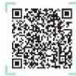
رشته‌های دانشگاهی علوم انسانی